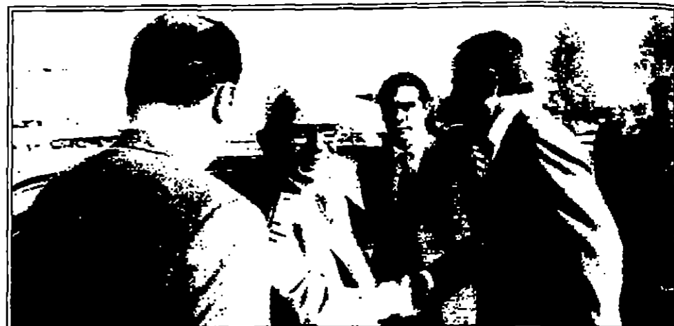
الشريف زيد يرحب بجلالة الحسين